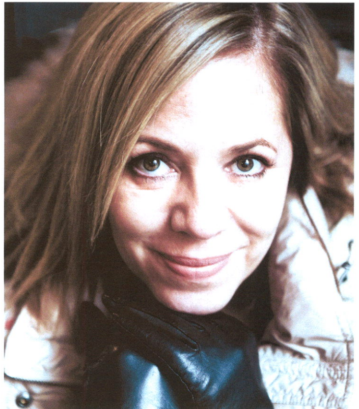
SKRIVETERAPI! Dødsfald i familien inspirerede Alyson Noël til at skrive historien om den udødelige pige Ever i serien 'De udødelige'.

I dag kan hun glæde sig over, at det gik trods alt, for flere af seriens bøger har siden ligget på New York Times' bestsellerliste.